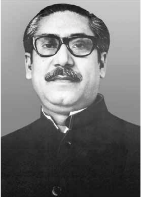
জাতির পিতা বঙ্গবন্ধু শেখ মুজিবুর রহমান [১৯২০-১৯৭৫]