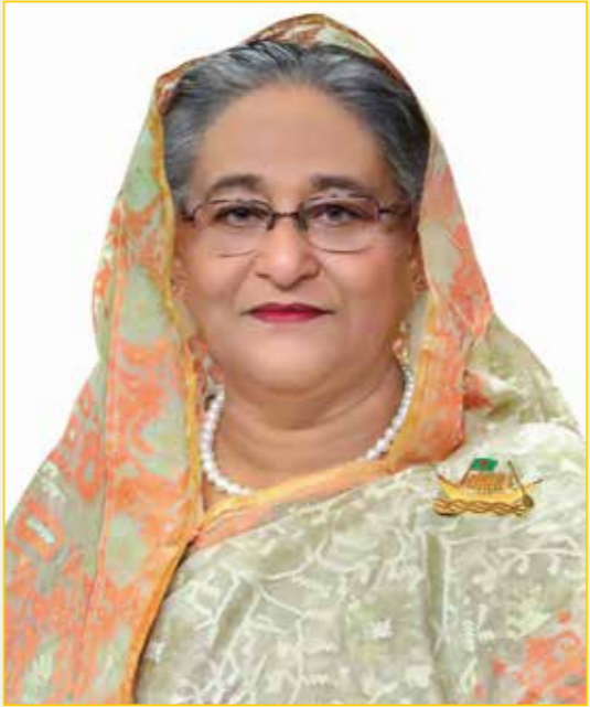
শেখ হাসিনা মাননীয় প্রধানমন্ত্রী গণপ্রজাতন্ত্রী বাংলাদেশ সরকার